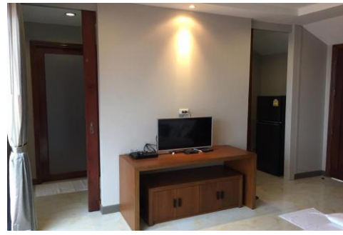
ภาพ Ocean View Family Suite (พัก 4 ท่าน)