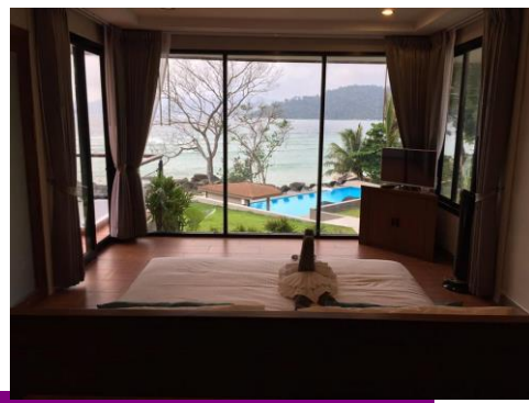
ภาพ Grand Deluxe Jacuzzi Ocean View (พัก 3 ท่าน)